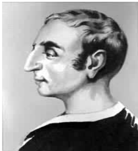
圣西门, H. de

19世纪上半叶，空想社会主义发展到最高阶段，代表人物有法国的圣西门、傅立叶和英国的欧文。